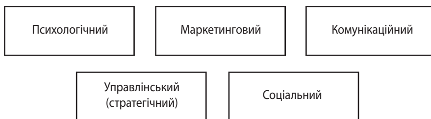
Рис. 1. Наукові підходи до визначення сутності іміджу підприємства

Психологічний підхід акцентує увагу на процесах сприйняття підприємства різними групами людей, а також на формуванні в їхній свідомості певних уявлень та емоційних оцінок щодо організації. У межах цього підходу імідж розглядається