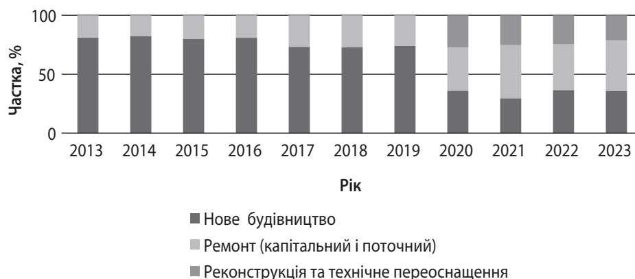
Рис. 3. Динамічність розподілення обсягів виробленої будівельної продукції за характером будівництва за 2014–2023 рр.