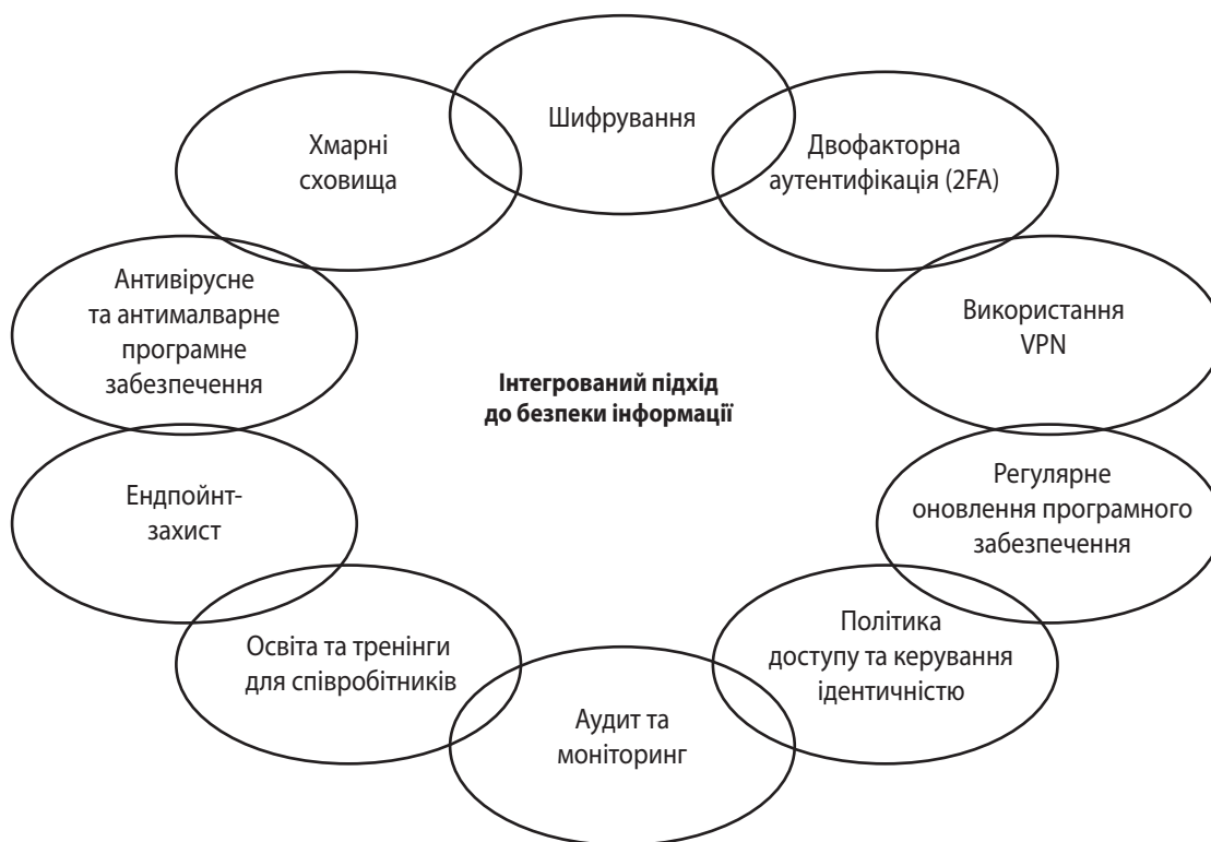
Рис. 3. Заходи захисту інформації під час цифрових переговорів