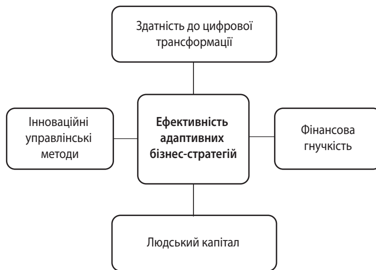
Рис. 1. Аналітична модель факторів ефективності адаптивних бізнес-стратегій