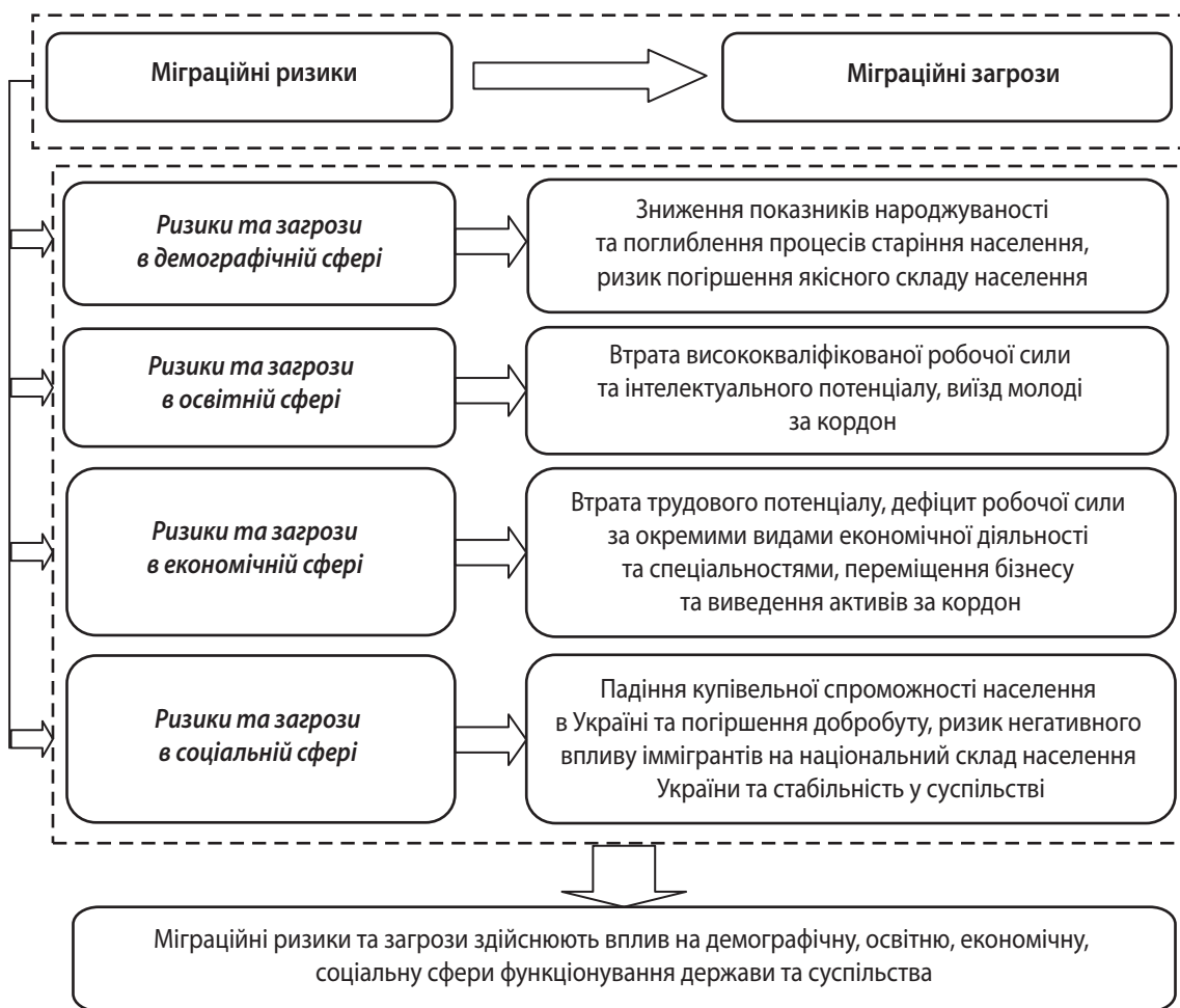
Рис. 3. Міграційні ризики та загрози в умовах воєнного стану в Україні