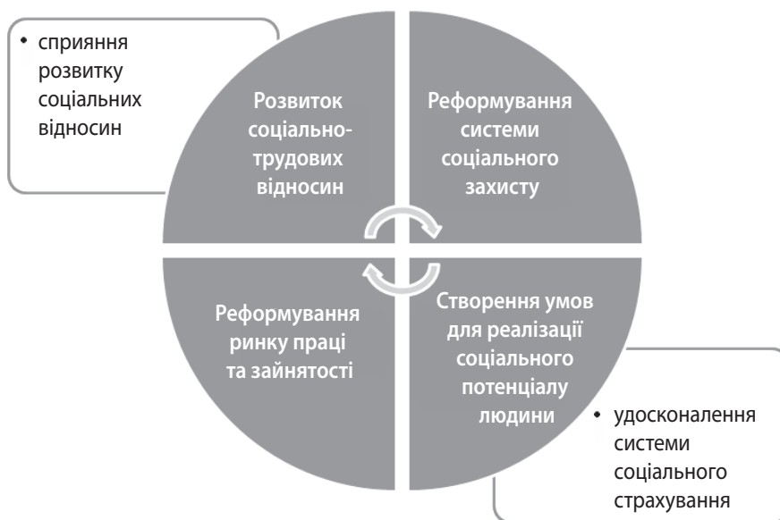
Рис. 1. Основні завдання соціальної політики

надає держава, недостатні для соціальної підтримки домогосподарств, адже розрив між часткою населення, чії середньодушові еквівалентні сукупні витрати є нижчими за фактичний прожитковий мінімум (тобто ця категорія людей постійно економить), та часткою домогосподарств, що відчують труднощі з матеріальними ресурсами для забезпечення первинних потреб (харчування), свідчить про використання раніше накопичених ресурсів, викривлення структури доходів та витрат домогосподарств і перехід населення в тіньовий сектор економіки [7]. Це підтверджує наявність проблемних аспектів у сфері субсидування житлово-комунальних послуг в Україні.