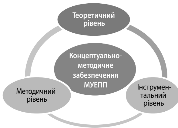
Рис. 1. Рівні концептуально-методичного забезпечення механізму економічної поведінки підприємства

«механізм управління економічною поведінкою підприємства» (МУЕПП) і сформуванню систему принципів, що лежать в основі його побудови та функціонування (рис. 2).