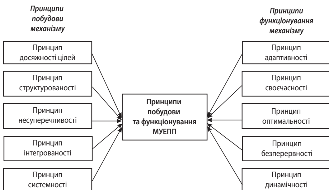
Рис. 2. Принципи побудови та функціонування механізму управління економічною поведінкою підприємства

Гіпотеза 5. Визначення тактики та стратегії розвитку підприємства потребує розробки сценаріїв управління його економічною поведінкою на підставі застосування моделей системної динамі-