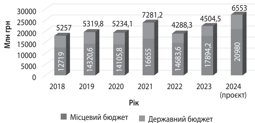
Рис. 2. Видатки Зведеного бюджету України на культуру та мистецтво за 2018–2024 (проєкт) рр., млн грн