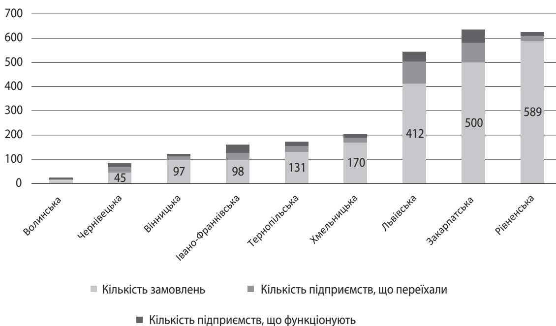
Рис. 3. Розподіл підприємств України щодо релокації за ознаками: кількість замовлень; кількість підприємств, що переїхали; кількість підприємств, що функціонують