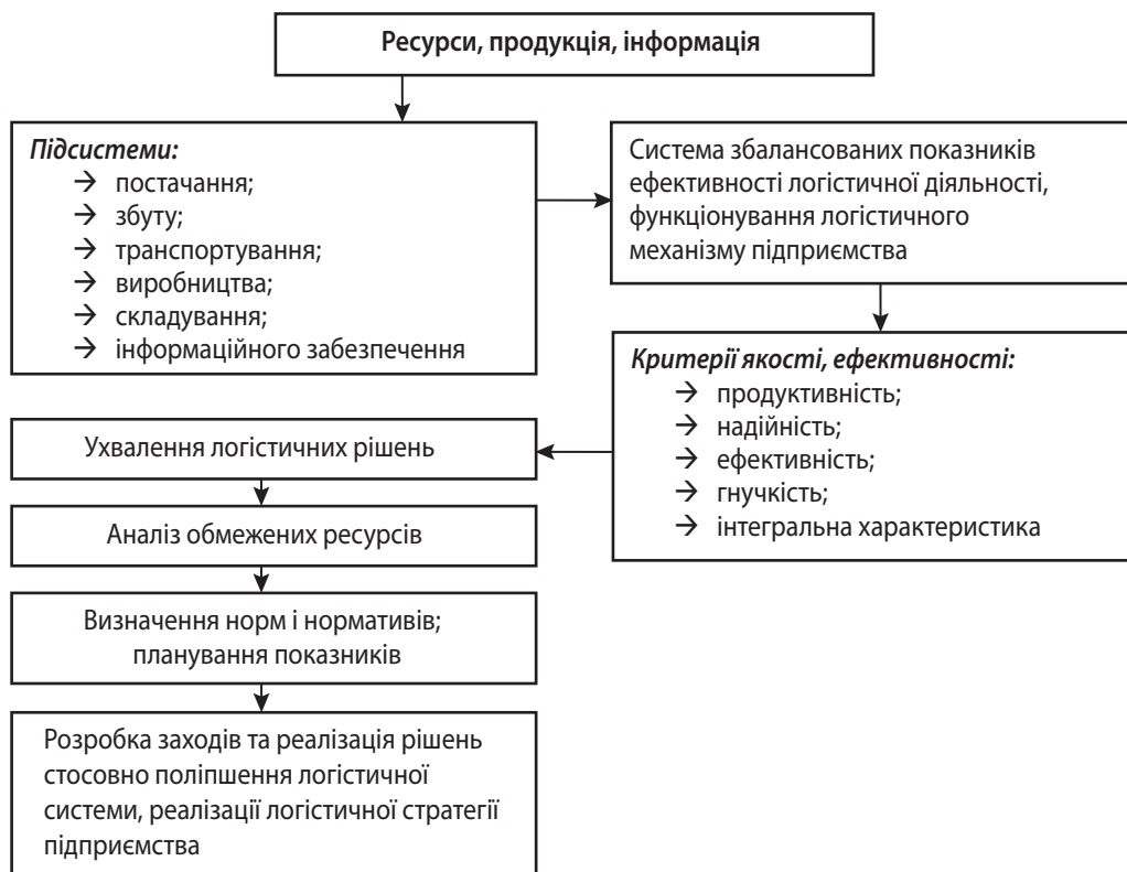
Рис. 1. Елементи та структура реалізації логістичного механізму розвитку підприємства

Під час формування методико-прикладних положень логістичного механізму розвитку підприємства важливо вказати й на тісні зв'язки цього механізму з іншими функціональними підсистема-