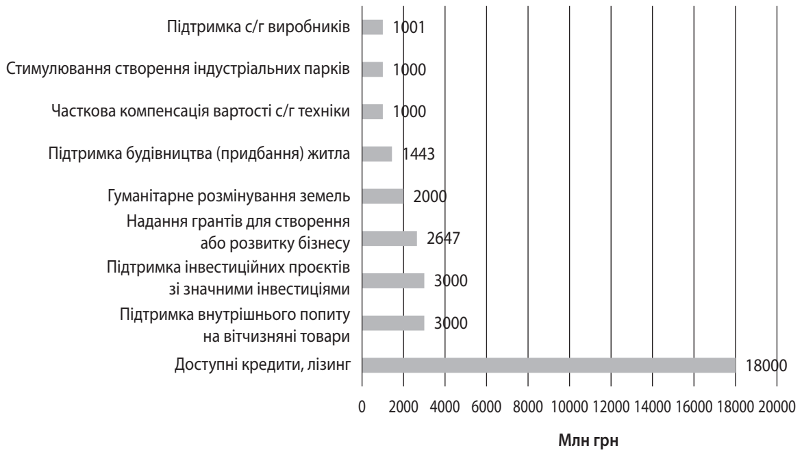
Рис. 5. Бюджетні програми підтримки економічного відновлення регіонів на 2024 р. [1]