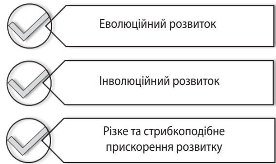
Рис. 1. Процеси розвитку суб'єкта підприємництва

Еволюційний і спосіб стрибкоподібного прискорення засновані на закономірностях зовнішнього середовища та подіях, що відбуваються в ньому. Усі процеси розвитку підприємництва між собою пов'язані.