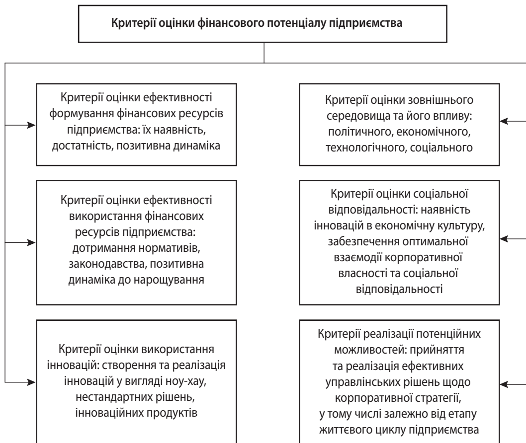
Рис. 2. Критеріальна модель оцінювання фінансового потенціалу