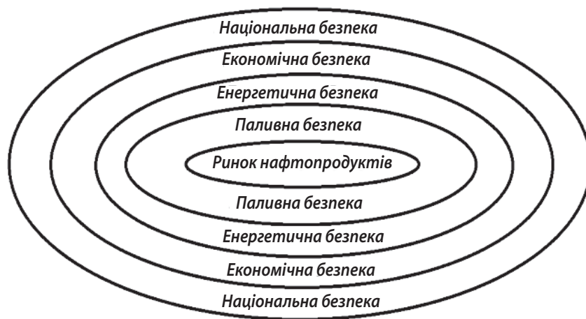
Рис. 1. Модель відносин ринку нафтопродуктів та національної безпеки