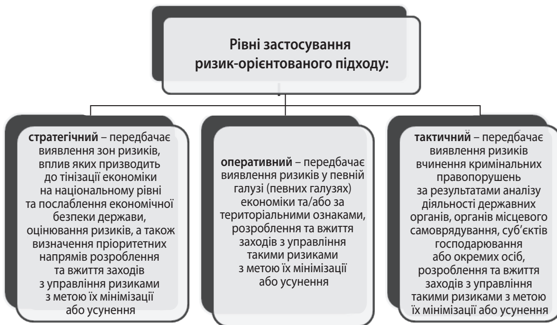
Рис. 1. Рівні застосування ризик-орієнтованого підходу в діяльності БЕБ