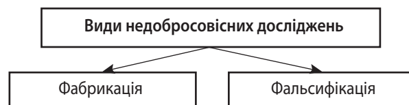
Рис. 2. Види недобросовісних досліджень

Т акож важливим принципом є сумлінне проведення досліджень . У публікаційній етиці під недобросовісним проведенням досліджень розуміється публікація даних або висновків, які не були отримані в результаті проведення експериментів або спостережень, а вигадані чи отримані внаслідок маніпуляцій. Види недобросовісних досліджень зображено на рис. 2.