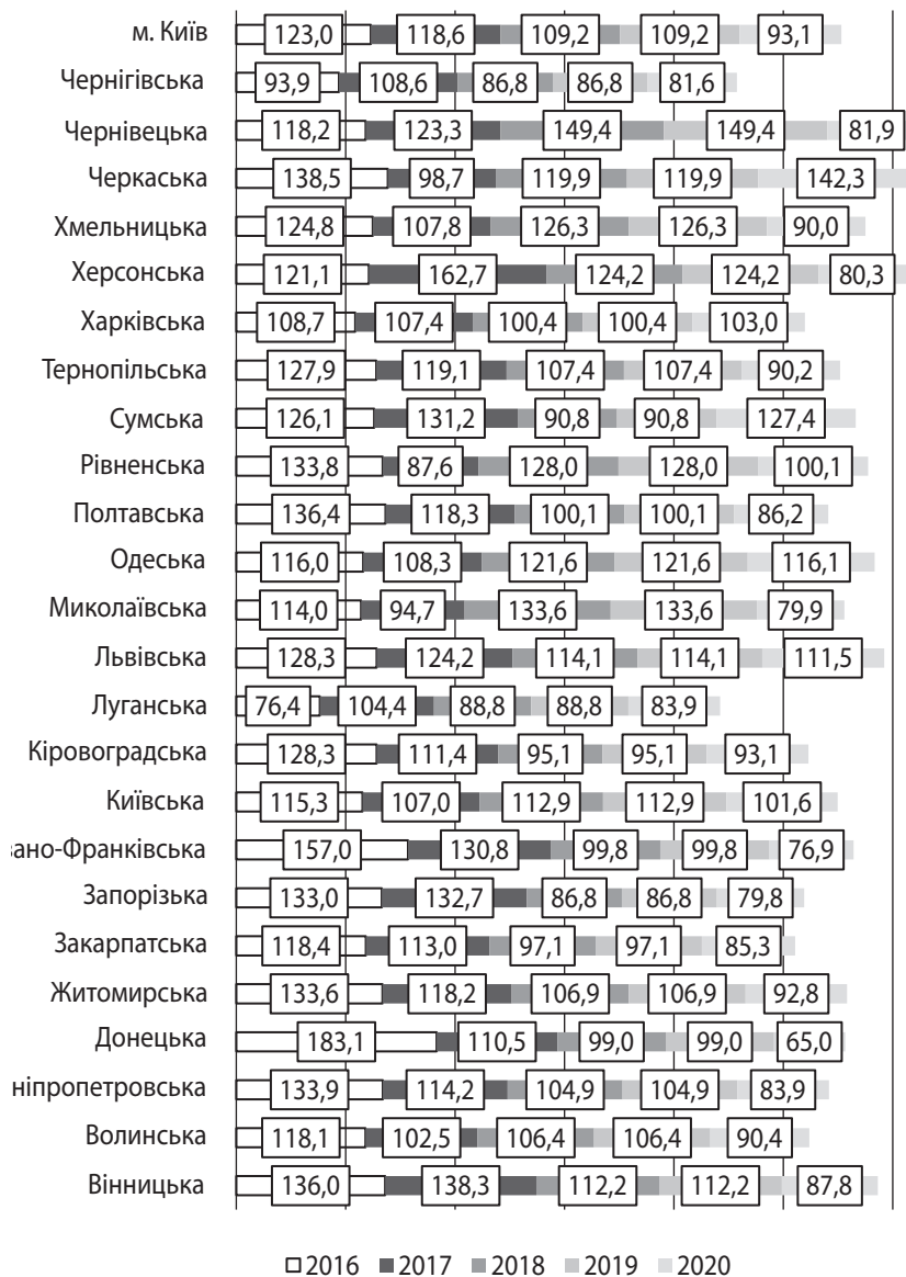
Рис. 2. Регіональні обсяги імпорту товарів (у % до попереднього року)

зниженням їх загального розвитку та специфікою виробництва. З розвитком просторового співробітництва в регіонах України змінюється пріоритетність їх економічних галузей. Так, з інноваційним розвитком більшість регіонів змогли налагодити відповідні виробничі відносини, створивши відповідні хаби.