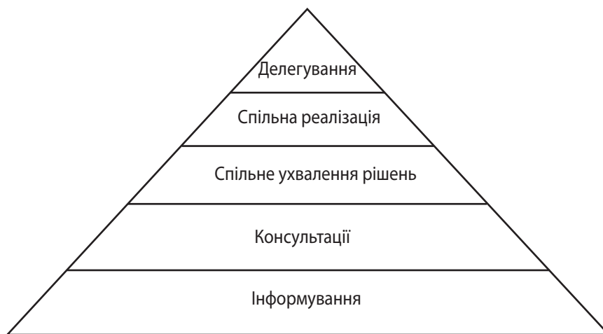
Рис. 1. Ієрархія процесу громадської участі залежно від рівня впливу суспільства