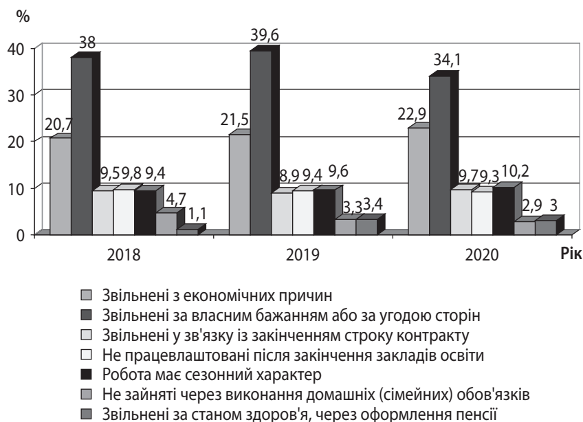
Рис. 3. Динаміка безробіття населення України за причинами незайнятості у 2018–2020 рр.