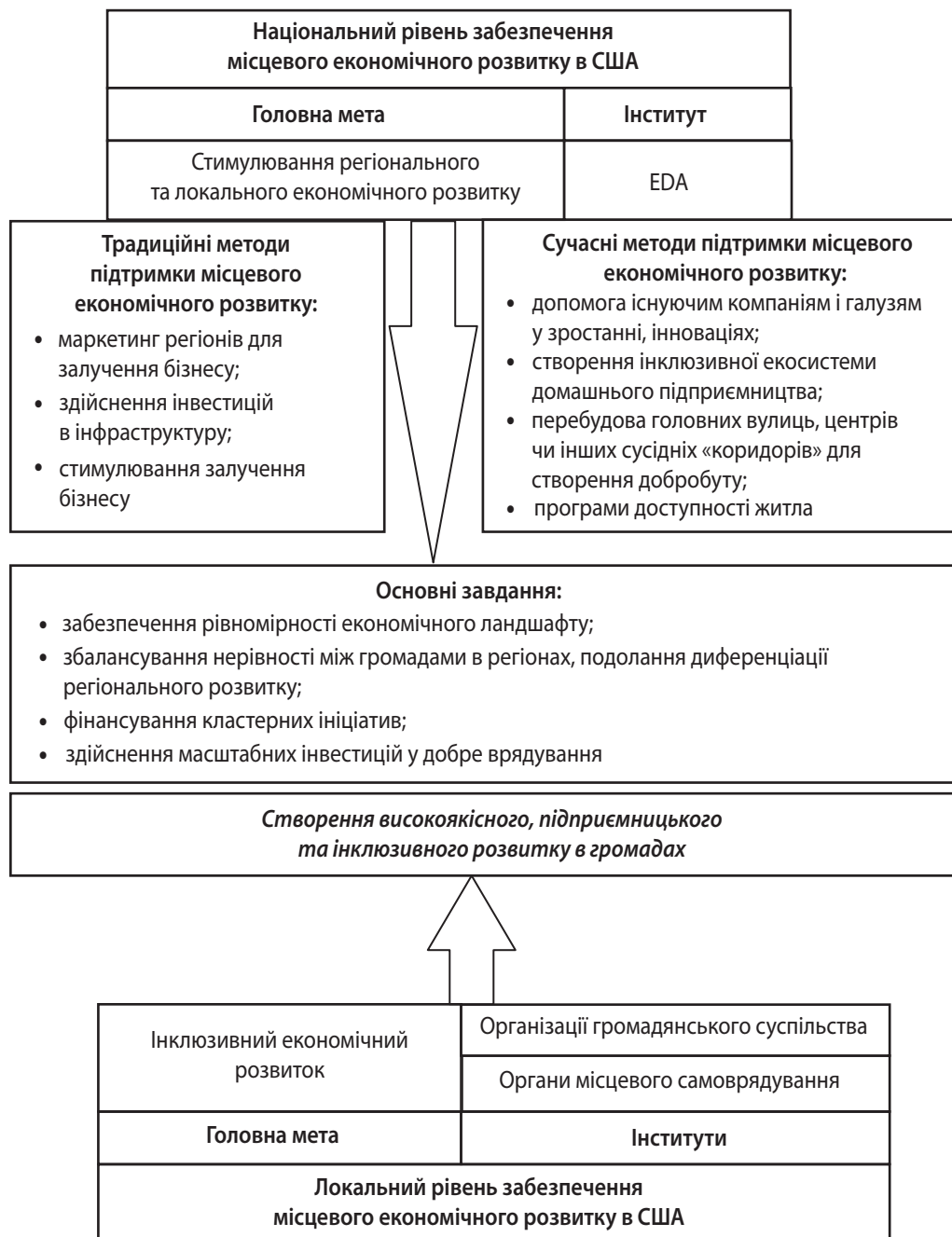
Рис. 1. Забезпечення місцевого економічного розвитку в США