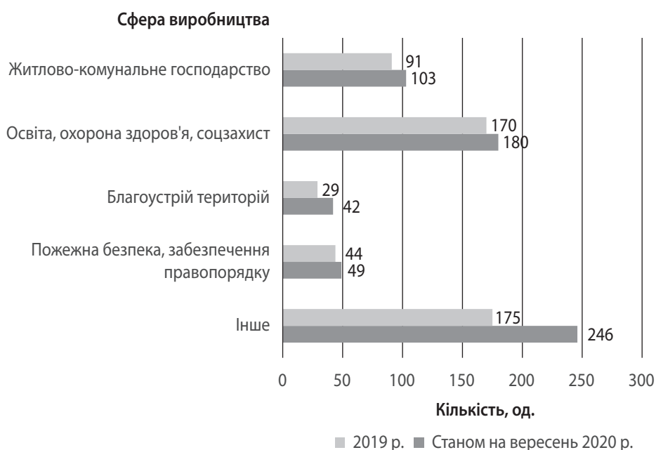
Рис. 3. Розподіл укладених договорів за сферами співробітництва територіальних громад в Україні