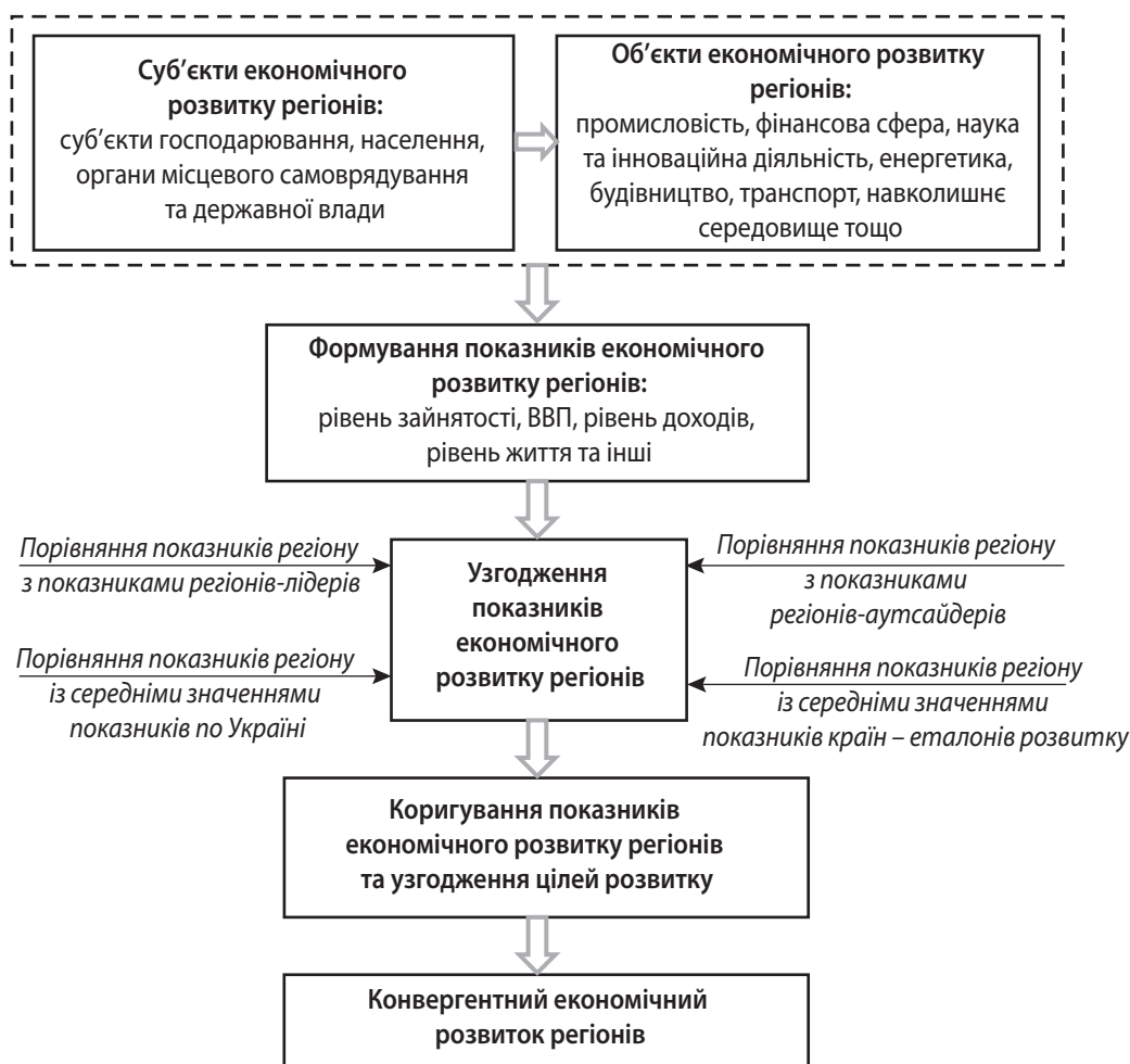
Рис. 2. Концепція конвергентного економічного розвитку регіонів України