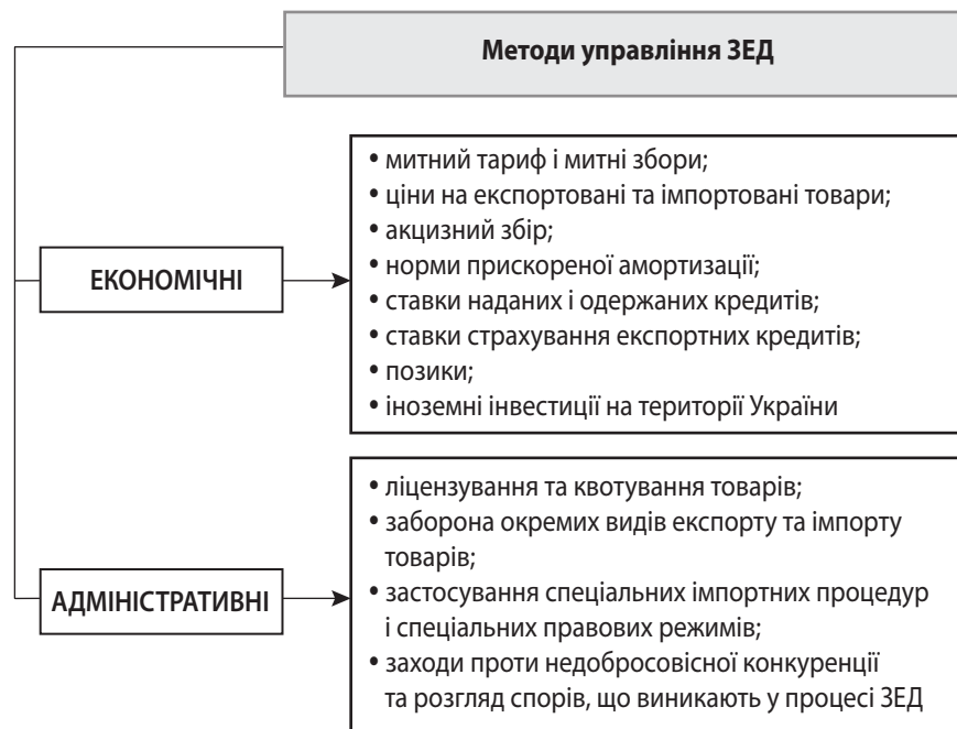
Рис. 2. Основні методи управління ЗЕД господарюючих суб'єктів України

3. Вихід на іноземні ринки шляхом створення власного виробництва продукції за кордоном, що передбачає істотну економічну вигоду за рахунок економії на: транспортних і митних витратах, наближення виробництва до джерел сировини тощо.