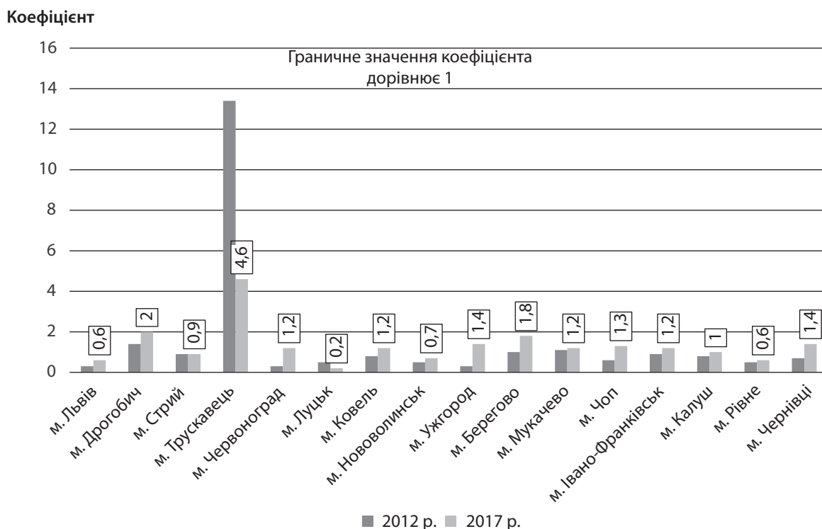
Рис. 2. Коефіцієнт покриття експортом імпорту за містами обласного значення Західного регіону України

Рейтингування міст за часткою експорту товарів і послуг у загальному обсязі експорту, швидкістю та інтенсивністю структурних змін в експорті товарів та послуг дозволить виокремити лідерів серед міст Західного регіону України та, відповідно, кращі практики здійснення експортної діяльності, які в підсумку забезпечили такий вагомий результат. З табл. 2 видно, що у 2017 р. більше 90% загального експорту в містах Калуш, Володимир-Волинський, Нововолинськ, Луцьк і Червоноград припадає на експорт товарів. За часткою експорту послуг п'ятірка лідерів як у 2012 р., так і у 2017 р. серед міст обласно-