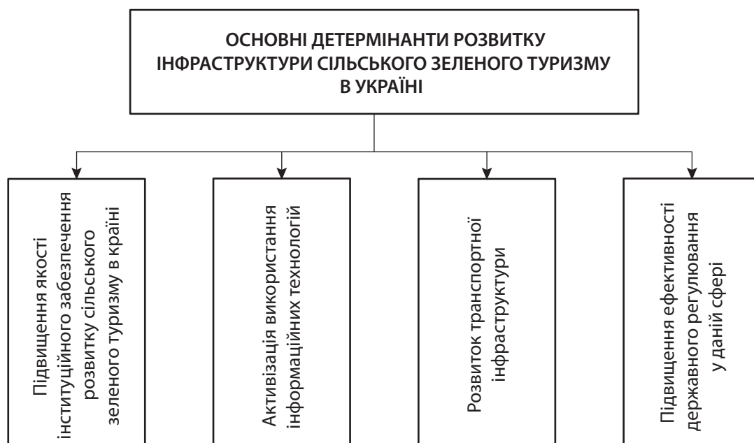
Рис. 1. Основні детермінанти інфраструктурного розвитку сільського зеленого туризму в Україні