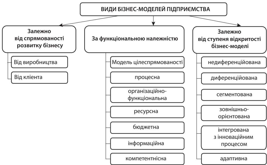
Рис. 1. Класифікація бізнес-моделей підприємства