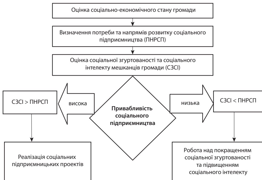
Рис. 3. Алгоритм прийняття рішення щодо привабливості та розвитку соціального підприємництва

1. Stiglitz J. E. After Neoliberalism. URL: https://www.project-syndicate.org/commentary/after-neoliberalism-progressive-capitalism-by-joseph-e-stiglitz-2019-05