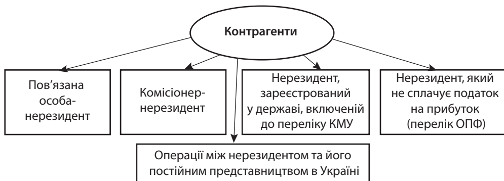
Рис. 2. Тип контрагента в контрольованій операції