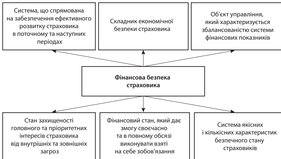
Рис. 1. Основні сутнісні характеристики фінансової безпеки страхових компаній

О тже, у 2018 р. частка валових страхових премій у відношенні до ВВП становила 1,4%, що на 0,1% менше порівняно із 2017 р. За цим індикатором можна визначити рівень фінансової без-