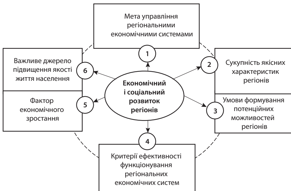
Рис. 1. Форми прояву економічного й соціального розвитку регіонів [10]

Економічний і соціальний розвиток регіонів – це критерій ефективності їх функціонування. Коли параметри кількісних показників регіонального розвитку перевершують запланований або нормативний рівень, показники стану розвитку аналогічних регіональних систем, можна зробити висновок про ефективне функціонування регіональних систем. Він створює базу та є важливим джерелом підвищення якості життя.