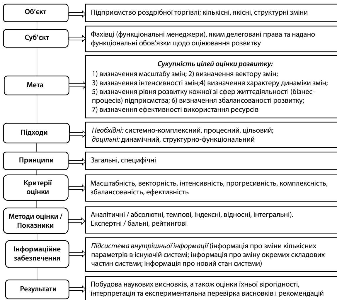
Рис. 3. Концептуальний підхід до оцінки розвитку підприємства роздрібно́ї торгівлі

15. Теоретичні основи конкурентної стратегії підприємства : монографія / за заг. ред. Ю. Б. Іванова, О. М. Тищенко. Харків : ВД «ІНЖЕК», 2006. 384 с.