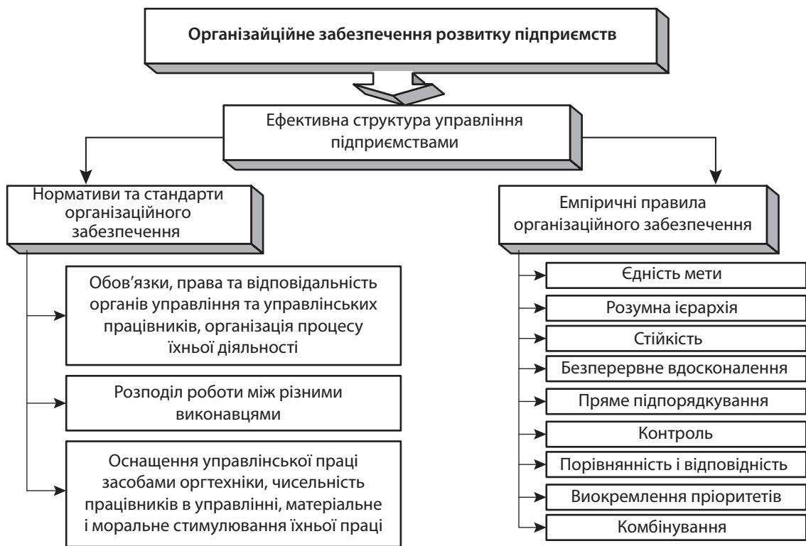
Рис. 2. Сутність організаційного забезпечення діяльності підприємства

виконанні фазових логістичних функцій та процесів, а саме [1; 5–7; 10; 11]: