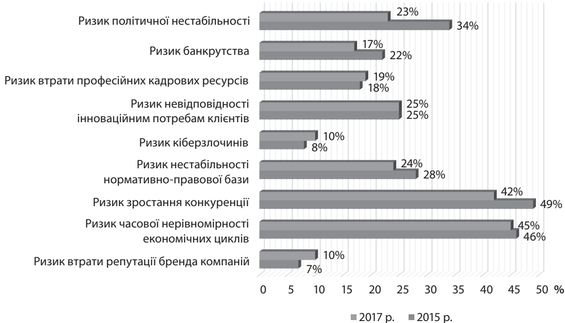
Рис. 1. Динаміка показника втрати доходів підприємств унаслідок впливу глобальних ризиків за період 2015–2017 рр., %