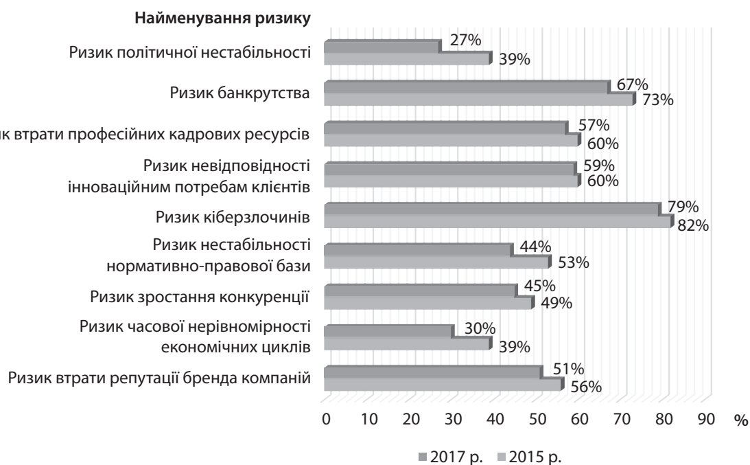
Рис. 2. Динаміка показника готовності до ризиків підприємств за період 2015–2017 рр., %