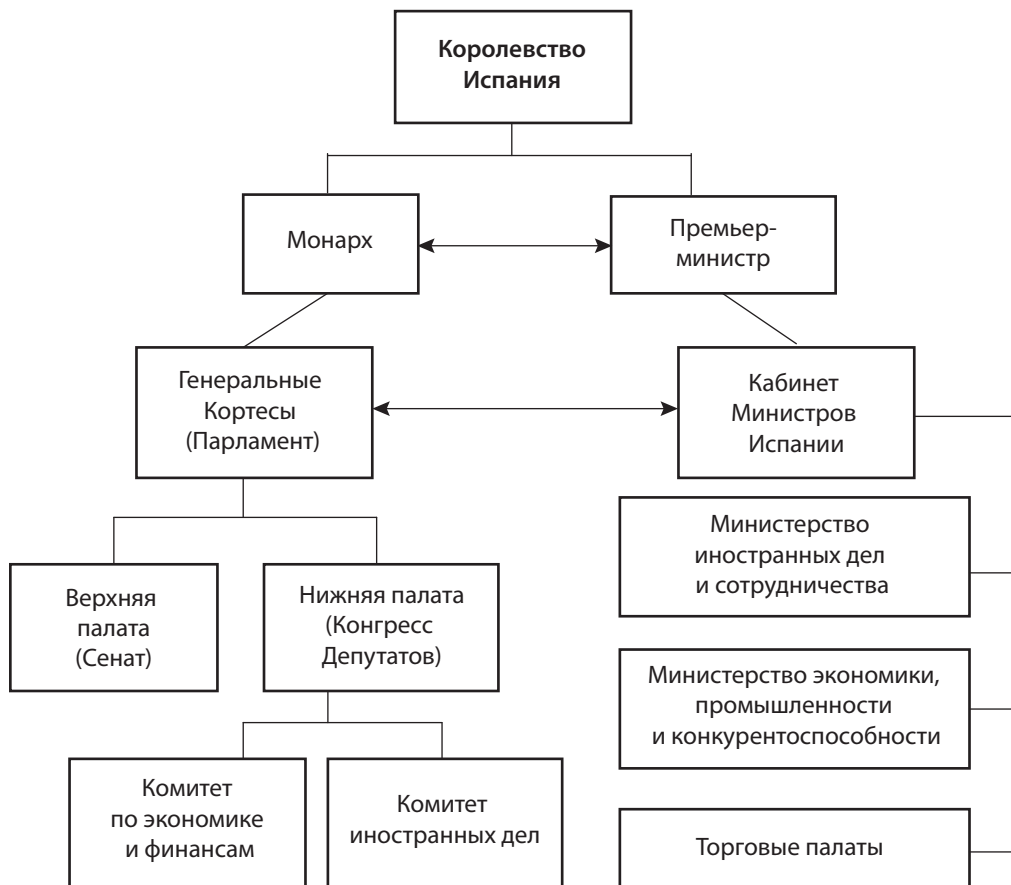
Рис. 1. Структура государственных органов, отвечающих за осуществление экономико-дипломатических отношений Королевства Испания