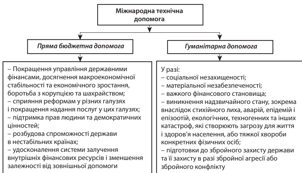
Рис. 1. Структура та цільове призначення міжнародної технічної допомоги

Пряма бюджетна допомога реалізується шляхом укладання міжнародної фінансової угоди для підтримки структурних реформ у країні, яка передбачає перерахування коштів на безоплатній і безповоротній основі до державного бюджету країни після виконання взаємоузгоджених умов для виділення коштів [1, с. 4]. Координа-