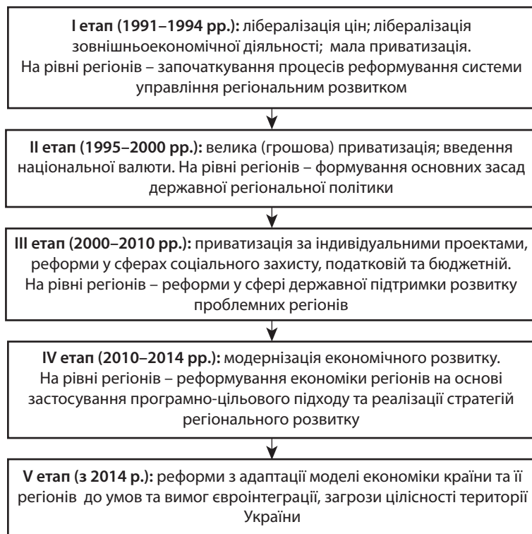
Рис. 1. Етапи економічних реформ в Україні та її регіонах у 1991–2016 рр.