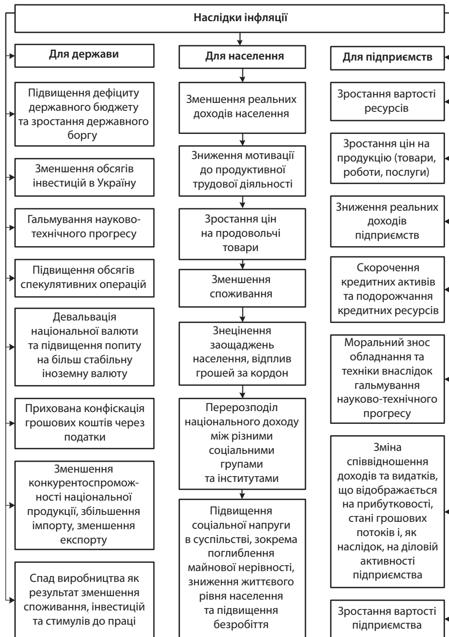
Рис. 1. Наслідки інфляції для держави, населення та підприємств

Отже, інфляція створює передумови для перерозподілу доходів між найманими працівниками та підприємцями на користь останніх. Зростання товарних цін як прояв інфляції безпосередньо сприяє збільшенню прибутків підприємства і зменшує реальні доходи робітників, службовців та інших верств населення, які змушені купувати товари за зростаючими цінами. У процесі дослідження ціноутворення на сільськогосподарську продукцію слід урахувати вплив трьох груп факторів: зміни вартості засобів виробництва та предметів праці; вартості робіт, послуг, насіння; та вартості послуг з переробки і реалізації продукції.