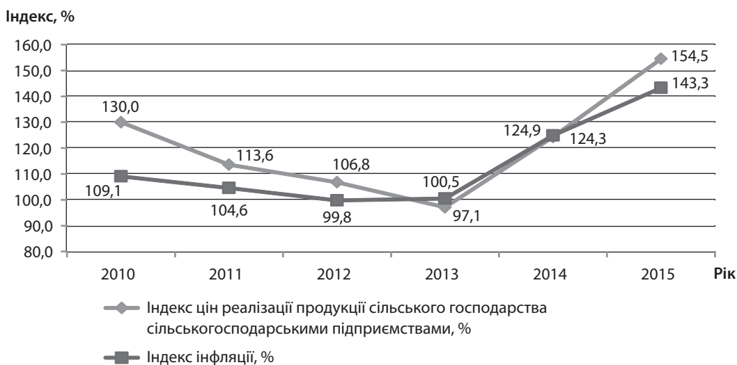
Рис. 3. Динаміка індексів цін реалізації продукції сільськогосподарськими підприємствами та індексів інфляції [14–16]