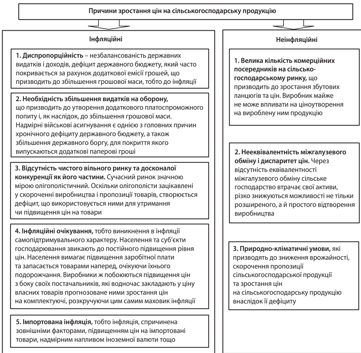
Рис. 2. Причини зростання цін на сільськогосподарську продукцію в Україні