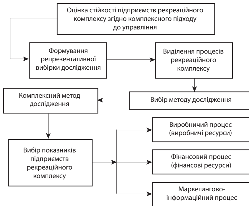
Рис. 1. Схема оцінки використання внутрішніх ресурсів за для стійкого функціонування підприємств рекреаційного комплексу