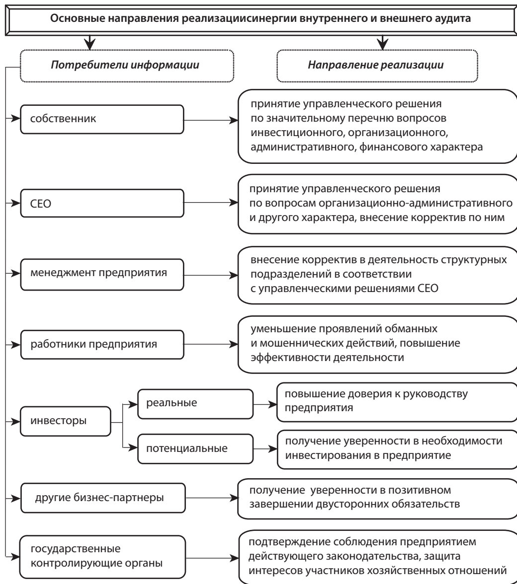
Рис. 2. Направления реализации результатов синергии внутреннего и внешнего аудита

но вопросы в таких сообщениях обязательно должны быть. Среди прочего отмечается, что аудитор должен своевременно сообщать тем, кто наделен наивысшими полномочиями в письменной форме, если устного сообщения информации было недостаточно. В сообщении обязательно приводятся данные об ответственности аудитора; запланированное время и объем аудита; приводятся значимые результаты аудита и подтверждается независимость аудитора.