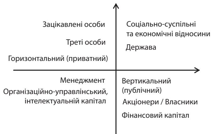
Рис. 2. Основні учасники та інтереси корпоративного конфлікту

Відтак, можна розмістити учасників відповідно до їх цілей. Наприклад, рейдери та конкуренти діють у забезпечення приватних інтересів, але їх дії публічні та зазвичай носять резонансний характер. Вертикально-публічні конфлікти мають на меті захист своїх прав і відносяться до держави, кредиторів та інших зацікавлених осіб, але вони частіше стають жертвами (рис. 2).