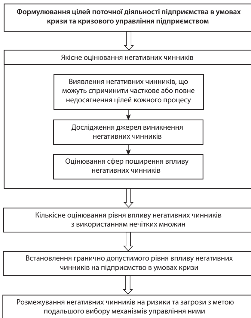
Рис. 1. Процес виявлення та оцінювання негативних чинників підприємства, що перебуває у стані кризи

Поточна діяльність підприємства в умовах кризи пов'язана з окремими видами ризиків і загроз, що характерні для підприємницької діяльності.