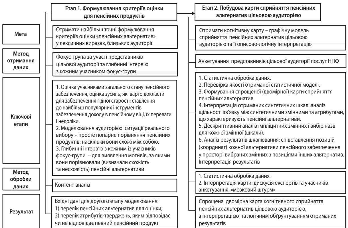
Рис. 1. Компаративний аналіз сприйняття «пенсійних продуктів»: методика дослідження