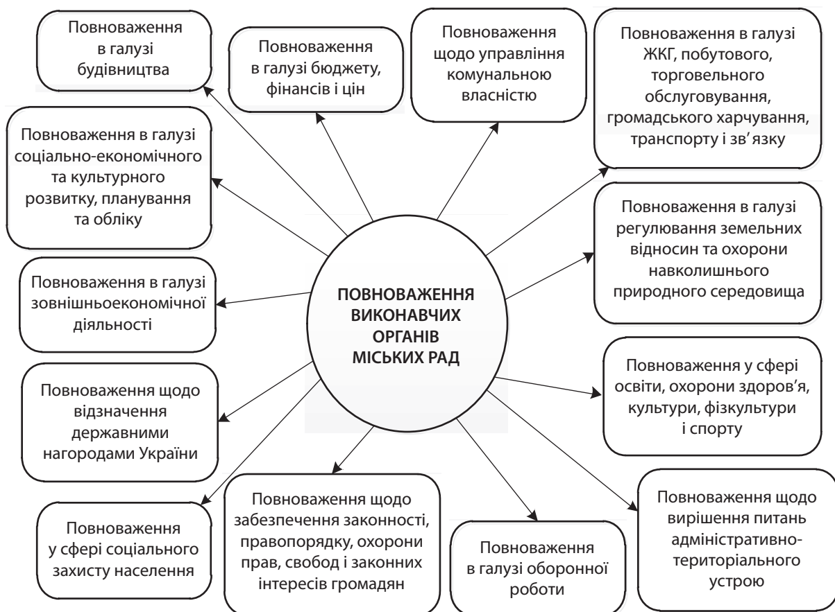
Рис. 2. Основні галузеві повноваження виконавчих органів міських рад

До повноважень соціально-економічного розвитку виконавчих органів міських рад слід віднести такі: