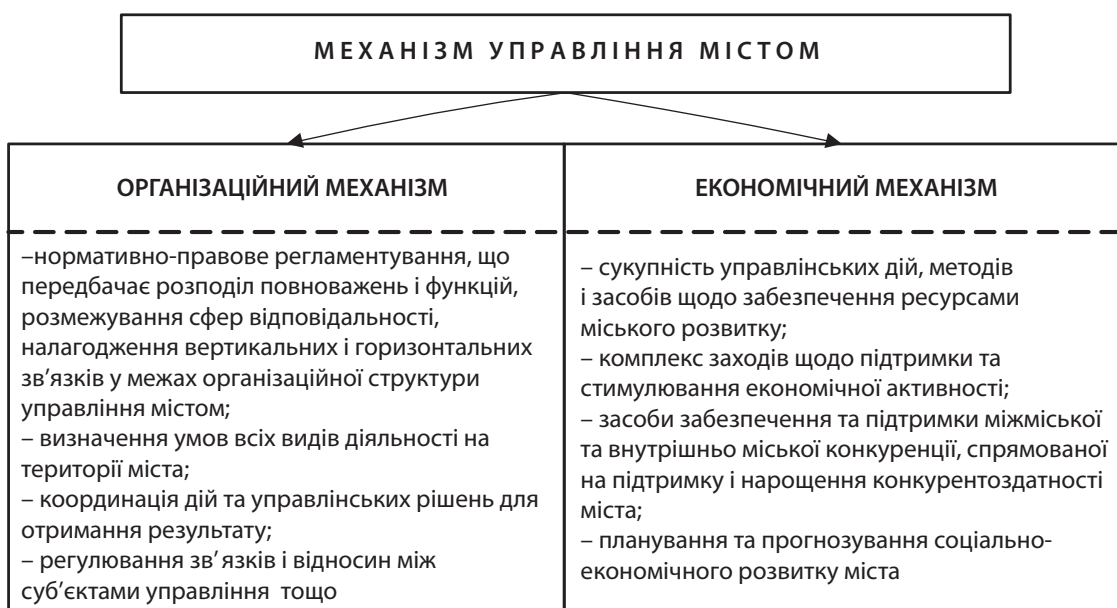
Рис. 5. Складові елементи механізму управління містом