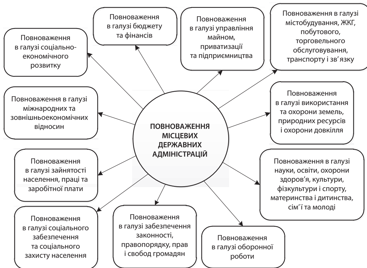
Рис. 1. Основні галузеві повноваження місцевих державних адміністрацій

Повноваження виконавчих органів міських рад можуть бути розподілені за сферами життєдіяльності, що представлено на рис. 2.