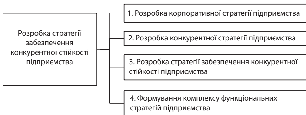
Рис. 3. Етапи процесу розробки стратегії забезпечення конкурентної стійкості підприємства

3 етап. Розробка стратегії забезпечення конкурентної стійкості підприємства на засадах інноваційного розвитку (рис. 3). Процес розробки стратегії забезпечення конкурентної стійкості підприємства включає етап розробки корпоративної стратегії підприємства, оскільки вона робить істотний вплив на характер поведінки підприємства у конкурентному середовищі.