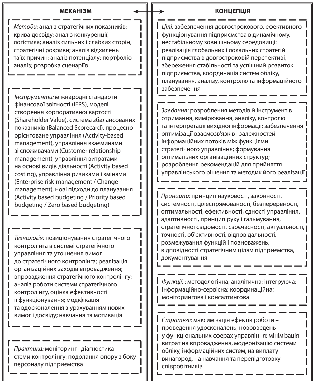
Рис. 2. Методологія стратегічного контролінгу

Визначення стратегічного контролінгу як координаційно-контролюючої й аналітично-інформаційної підсистеми стратегічного управління дає можливість суттєво вплинути на реформування та реконструкцію системи стратегічного управління підприємства. Подальші дослідження треба спрямувати на визначення основних напрямів застосування стратегічного контролінгу на підприємстві. ■