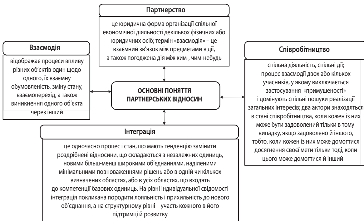
Рис. 2. Основні поняття, що розкривають зміст партнерських відносин

В етимологічному словнику української мови зазначено, що слово «партнер» в українську мову запозичене із французької, у свою чергу, французьке «partenaire» походить від англійського «partner», яке має кілька значень, зокрема, «співспадкоємець», «поділ», «частина» тощо [15]. Партнерство в сучасному розумінні – це вид взаємин між різними суб'єктами, який полягає у формуванні єдиної позиції з певних питань та організації спільних дій. Специфікою партнерства є збереження кожним з партнерів відносної самостійності в основних аспектах діяльності. Тож партнерство як вид спільної діяльності полягає в рівноправності її учасників, що передбачає рівні права й обов'язки кожної зі сторін, а відтак і взаємну відповідальність. Отже, партнерство – це ідеальний варіант стосунків рівноправних суб'єктів, які усвідомлюють значення своїх дій для партнера і свою діяльність будують так, щоб виправдати сподівання партнера і досягти спільної мети. Партнерство можливе лише за умови взаємної довіри,