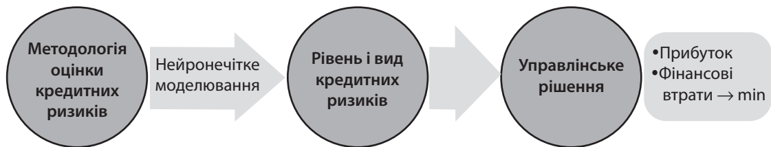
Рис. 3. Вплив ННМ на фінансовий результат банку

2. Оскільки банки функціонують в різних ринкових умовах і їх структура є різною, то й управління кредитними ризиками здійснюється по-різному. Проте всі системи ризик-менеджменту мають і спільні риси, а ефективність управління значною мірою залежить від належного інформаційного базису при прийнятті рішень менеджерами банку.