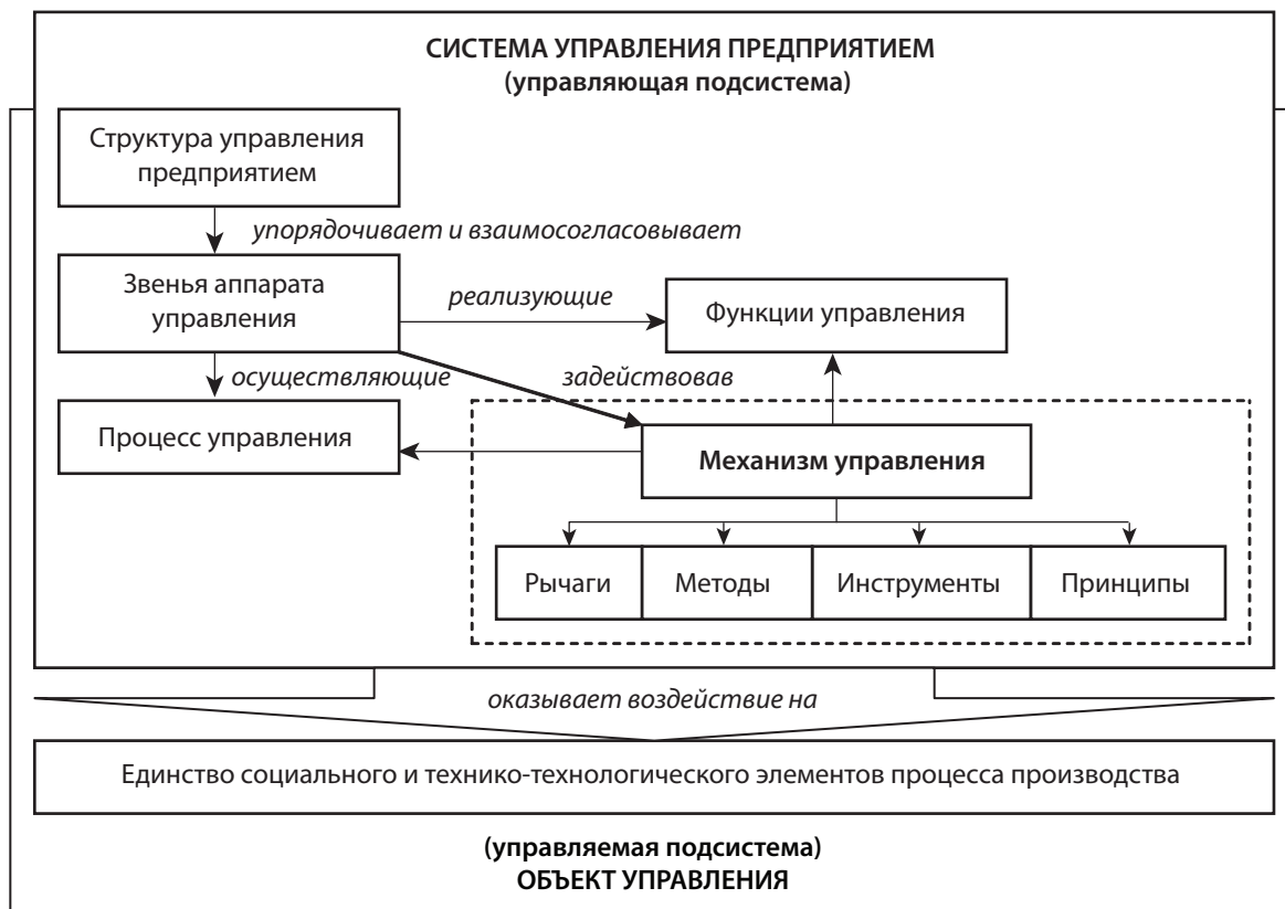
Рис. 2. Механизм управления как элемент системы управления предприятием

Неотъемлемым элементом механизма управления являются принципы управления, определяющие его качественное содержание. Наряду с общими принципами управления, разработанными школой научного менеджмента и класси-