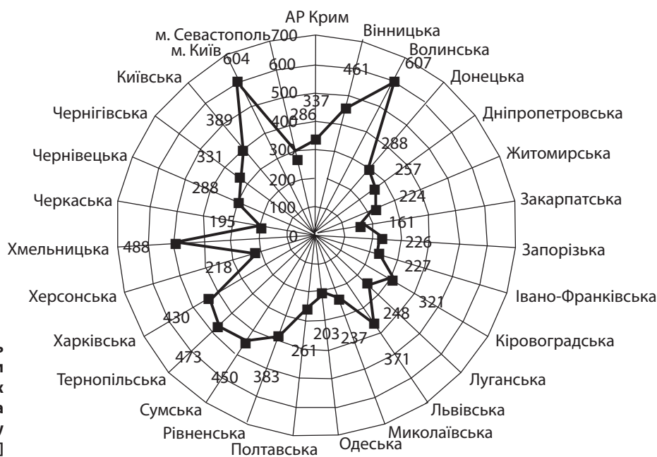
Рис. 1. Забезпеченість населення посадковими місцями в об'єктах ресторанного господарства в 2012 р. (на 10 тис. осіб у розрізі областей) [7, с. 108]

Слід наголосити на нерівномірності забезпечення населення посадковими місцями ресторанного господарства в розрізі окремих регіонів. Найвищим рівнем відзначаються м. Київ (604 од.), Волинська (607 од.), Хмельницька (488 од.), Тернопільська (473 од.) області, а найнижчим – Закарпатська (161 од.), Черкаська (195 од.), Одеська (203 од.) та Херсонська (218 од.) області (рис. 1).