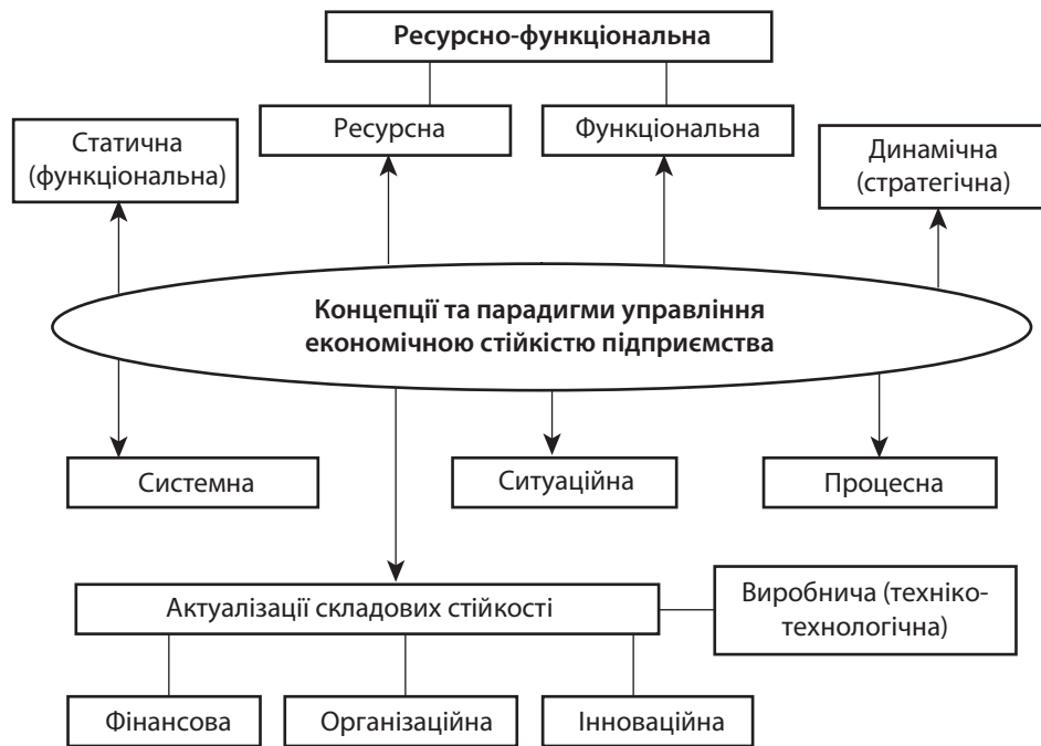
Рис. 1. Основоположна база формування концепцій та парадигм управління економічною стійкістю суб'єкта господарської діяльності

ня як комплекс взаємопов'язаних ресурсів із різним рівнем впливу кожної складової на загальну довгострокову стійкість економічної одиниці.